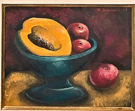
Bodegón que se exhibe actualmente en el Musa como parte de la muestra “El Universo de lo Femenino”.

La muestra será inaugurada el próximo 10 de septiembre.