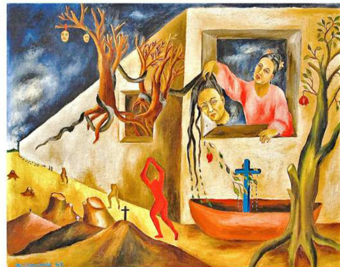
“Sueño y Presentimiento”, óleo de María Izquierdo que será parte de homenaje en el Museo Cabañas.