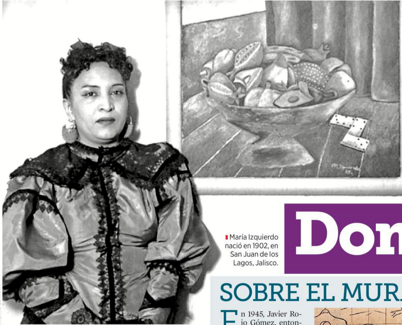
María Izquierdo nació en 1902, en San Juan de los Lagos, Jalisco.

Sin embargo, esa guerra, que inspiró su célebre frase “Es un delito nacer mujer. Es un delito aún mayor ser mujer y tener